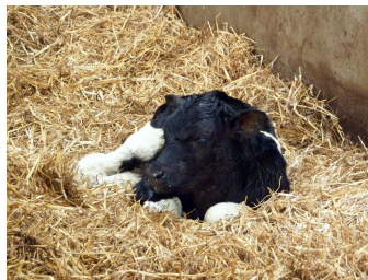
Varmebehandlet råmælk og sødmælk giver en god start for kalven, hvis det håndteres korrekt.

Se 'European Agricultural Fund for Rural Development'